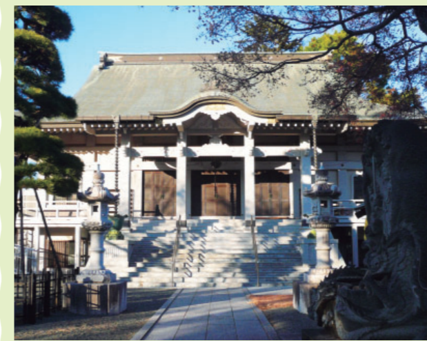
鎌倉時代の1258年(正嘉2年)には幕府5大執権を務めた北条時頼が立ち寄ったとも伝えられているそうです。