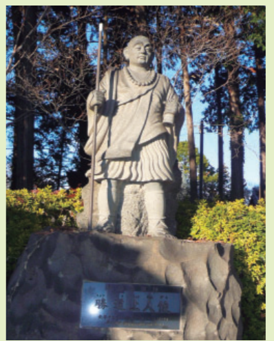
善勝寺を創建した勝道上人 像