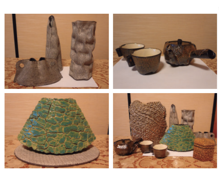
趣味友の輪 榎垣 茂雄さん (荒牧町)

◆チラシ折込エリア(富士見・南橋・芳賀地区)◆ 作品や自慢などを募集しています。書道や俳句、お孫さんやペットの自慢でもかまいません!ご希望の方はメールまたはお電話にてお申し込み下さい。ジャンルは問いませんので、部員募集などでもかまいません。